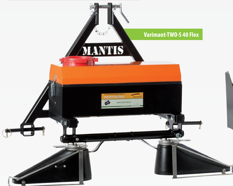
Varimant-TWO-S 40 Flex